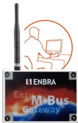
Zber údajov ON-LINE pomocou centrály ENBRA EASY (AMR)