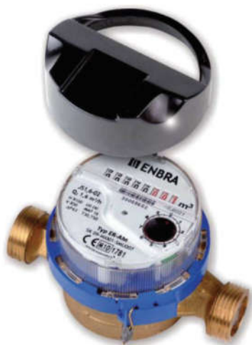
Vodoměr ENBRA ER-AM s modulom JS-02

ENBRA Engelmänn HCAe2 (Walk-by, AMR) je súčasťou komplexného rádiového systému zberu dát, do ktorého patrí aj bytový vodoměr ENBRA ER-AM s rádiovým modulom JS-02 . Kvôli možnosti dodávky vodoměrů s rádiovým prenosom dát bez nutnosti vstupovania do bytov, kontaktujte svojho dodávateľa PRVN alebo svojho správcu bytového domu.